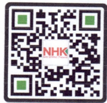
สายบางปู