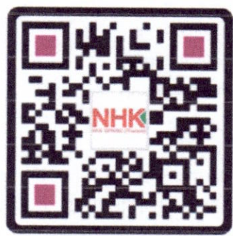
สายเวลโกรว์