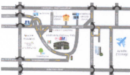
MAP-New Ho.JPG 146K